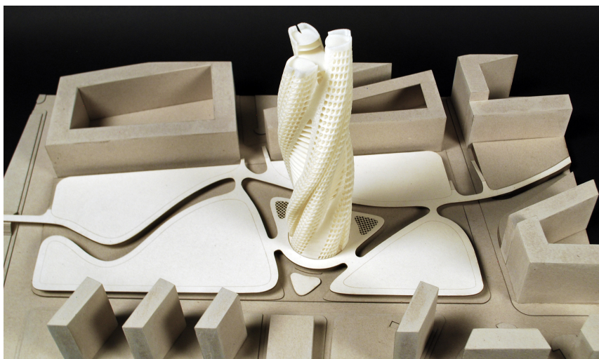
Modell, Maßstab 1:600 / Model, scale 1:600