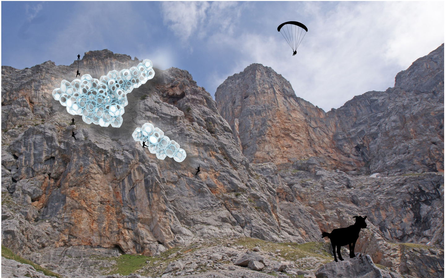
Schaubild, Lage und Umgebung / Visualisation, location and surrounding

Der Baukörper dient als Basislager für Kletterer und Bergsteiger. Er ist am Hochplateau des Steinernen Meeres in Saalfelden, nahe den Einstiegsstellen zu vielen Klettersteigen und Bergrouen situiert.