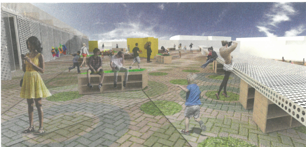
↶ de Schaubild Vogelperspektive en Figure aerial view ↷ de Lageplan en Site plan ↵ de Schaubild Terrasse Gemeinschaftszentrum en Figure terrace community centre