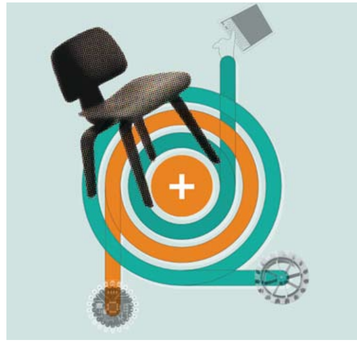
Beliebige Objekte werden zu intelligenten Gegenständen, wenn sie mit Sensoren, Aktoren und Computern ausgestattet sind.

Die erste Gruppe bezeichnet man in Regel als „smart“, weil sich ihre optischen, mechanischen, elektrischen, magnetischen oder sogar biologischen Eigenschaften unter Einfluss einer externen Anregung verändern können. Dabei verändern sich die Eigenschaften des Materials in eine programmierte Richtung und kehren in den Ausgangszustand zurück, sobald die Anregung wegfällt. Die bereits entwickelten und eingesetzten Werkstoffe wirken selbstreinigend, selbstheilend, keimtötend, vor Bränden schützend und dergleichen.