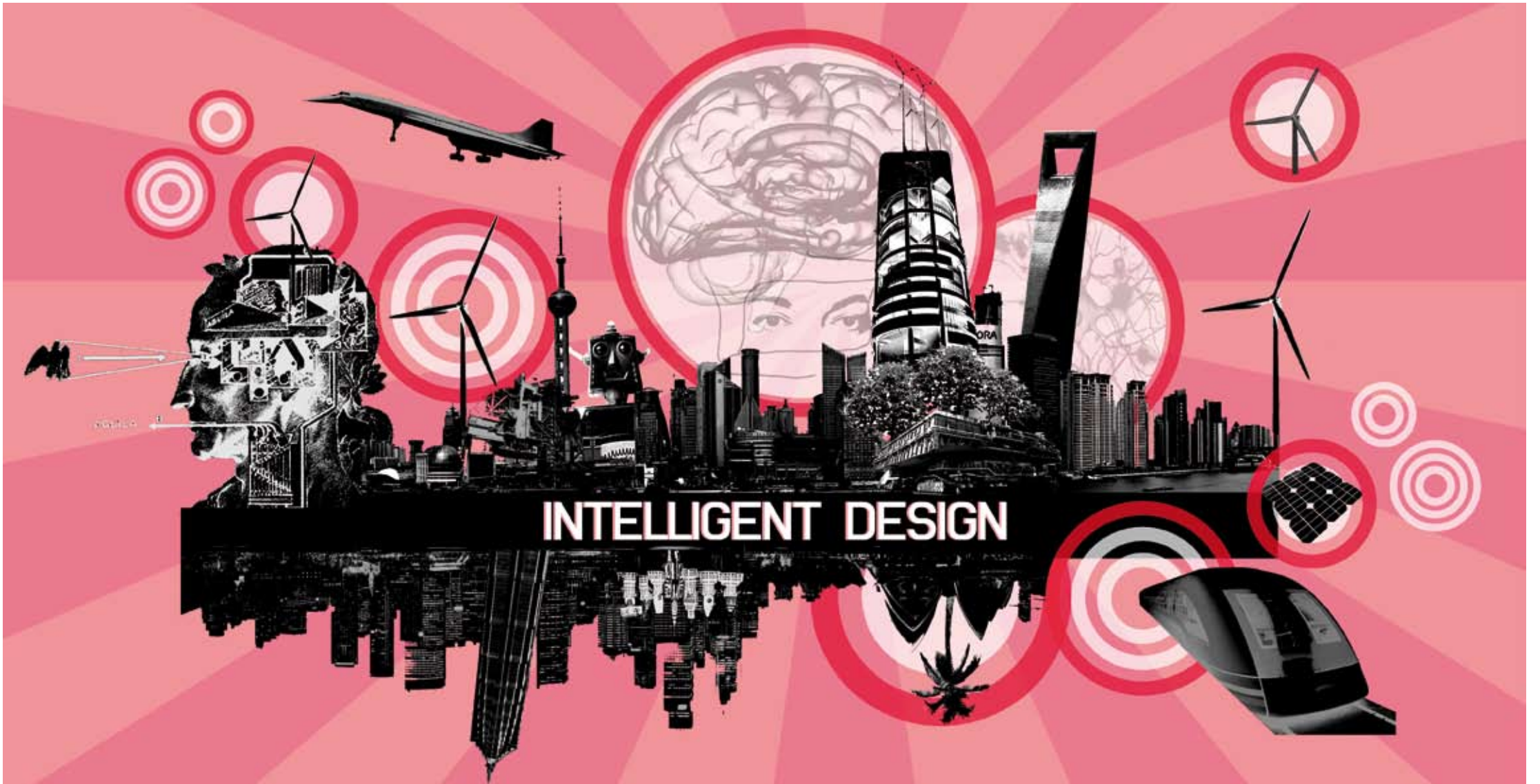
Adaptive Materialien und „intelligente“, computergesteuerte Objekte bieten viele neue Einsatzmöglichkeiten in der Architektur und der Bauwirtschaft. Illustration: Jadric Architektur ZT GmbH

DIE ÖSTERREICHISCHE FACHZEITSCHRIFT FÜR BAUKULTUR | P. b. b. Verlagspostamt 1050 Wien Zul. Nr. GZ 02Z030751 W | 2,80 € | # 398 | 24. Jänner 2011